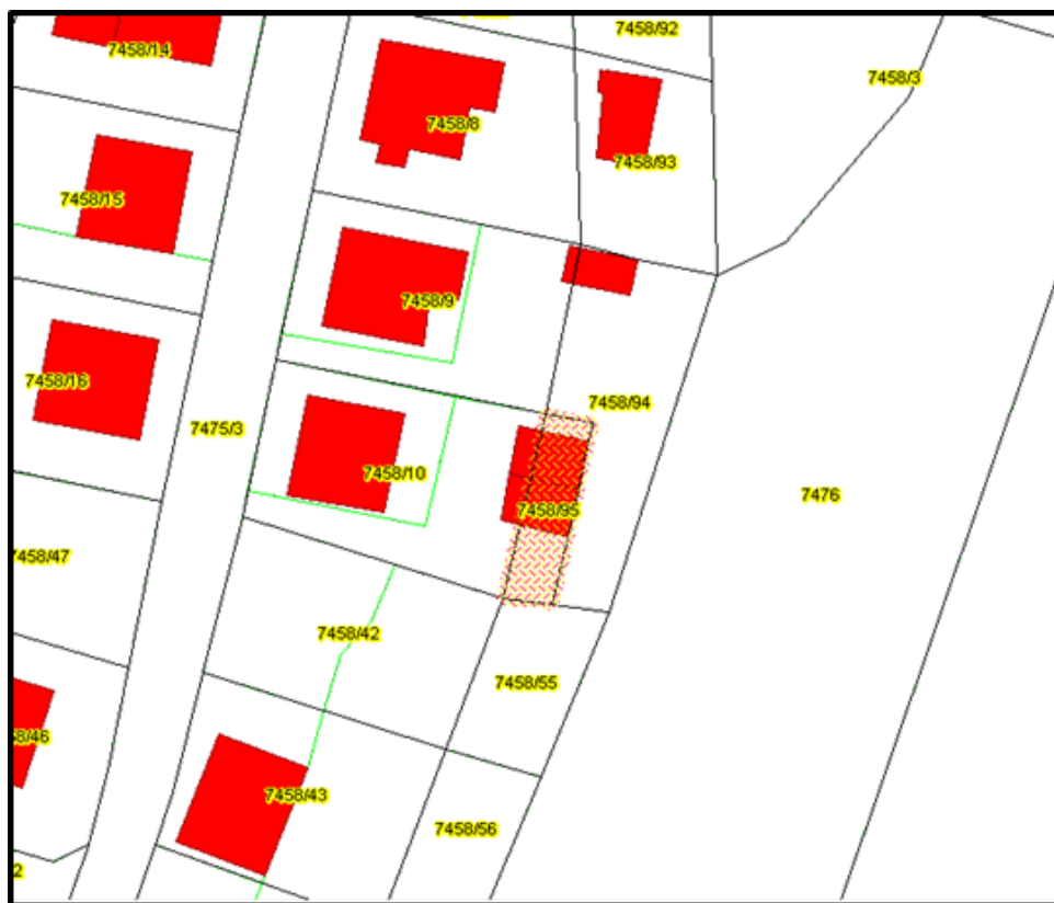
Lokalizacja działki ewidencyjnej nr 7458/95