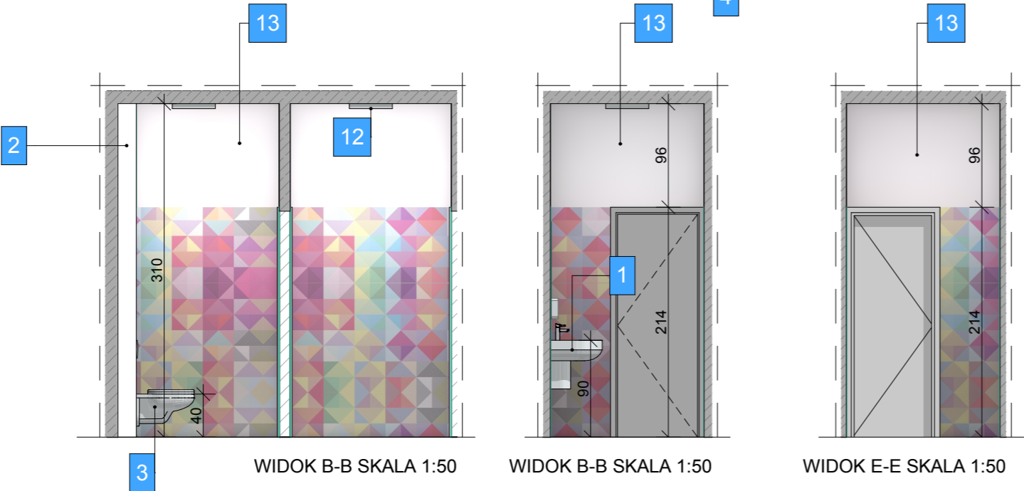
WIDOK B-B SKALA 1:50