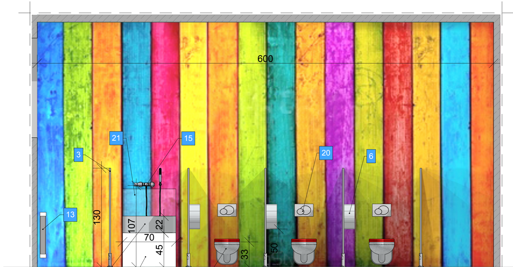
WIDOK D-D SKALA 1:25